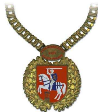
ABZEICHNEN DER STADTRATS- MITGLIDER