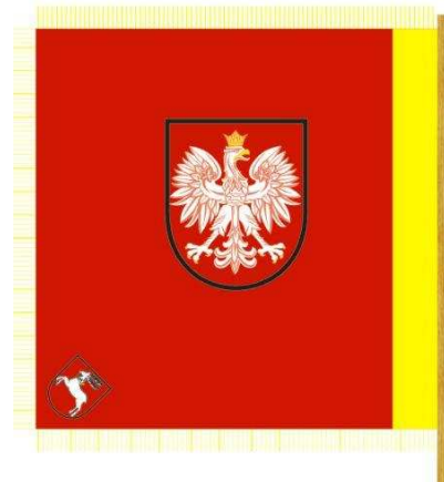
ABZEICHNEN DES VORSIZENDES DES STADTRATES